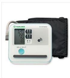
血圧計 NFCリーダー/ライター 経由送信