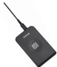
非接触ICカードリーダー