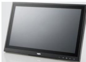
タッチ式PC またはノートPC (Bluetooth機能付)